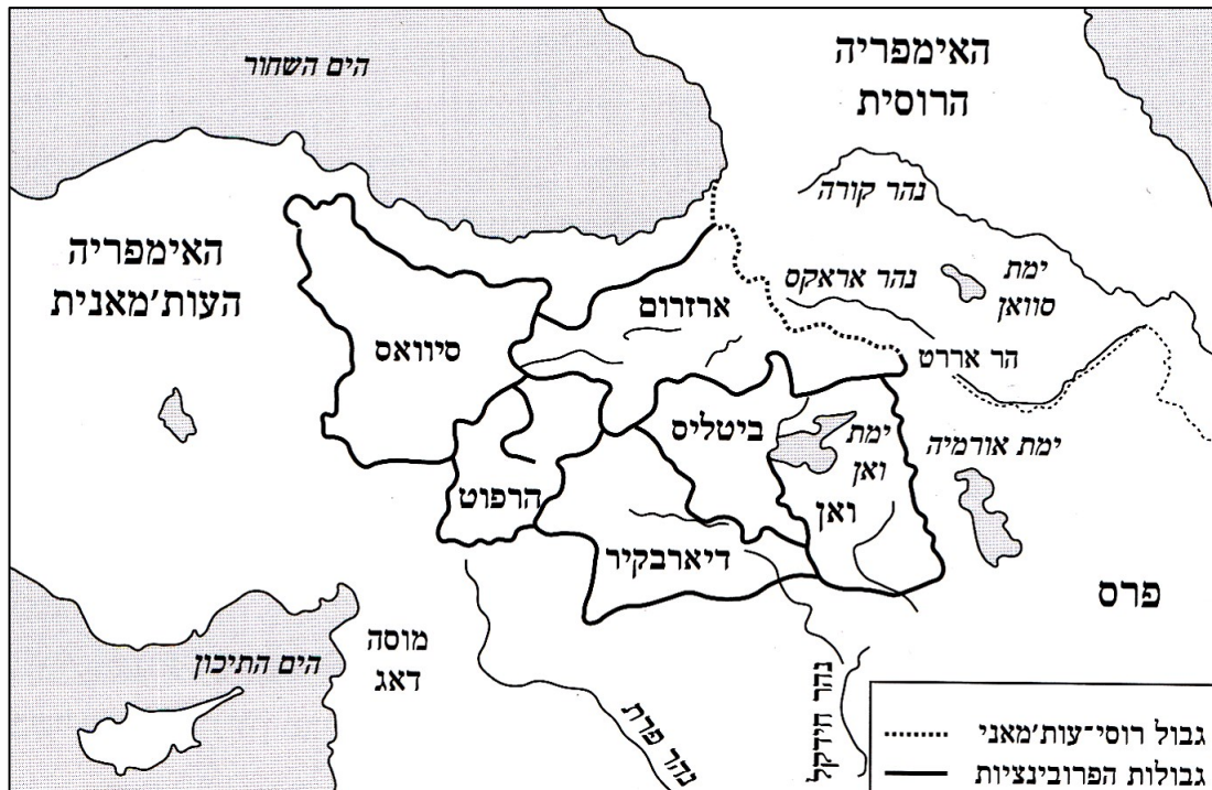
ששת הפרובינציות הארמנים בתחום האימפריה העות'מאנית

במחצית השנייה של המאה ה-19, בהשפעת תנועת ההתעוררות הלאומית ("אביב העמים") באירופה, תנועת ההתחדשות ("תנזימאט") והמאבקים הלאומיים באימפריה העות'מאנית, 7 פיתחו הארמנים שאיפות לאומיות שבסיסן איחוד העם הארמני תחת אוטונומיה מדינית-לאומית אחת בשטחיה של ארמניה ההיסטורית. 8 במסגרת גיבוש הזהות הלאומית הארמנית נוסחו "תקנות האומה הארמנית" (1860) שהפרידו בין מעמד הפטריארך הארמני כמנהיג דתי ו"האסיפה הלאומית הארמנית" כגוף ההנהגה האזרחי של הקהילה ואשר אושרו בידי השלטונות בשנת 1863, הוקמו בתי ספר וארגונים ארמנים ברחבי האימפריה ונוסדו מפלגות פוליטיות-לאומיות ארמניות. 9 במקביל החלה התארגנות צבאית ללוחמת גרילה שהופנתה בעיקר כנגד המיעוטים ששכנו בסמיכות לקהילות הארמניות. 10