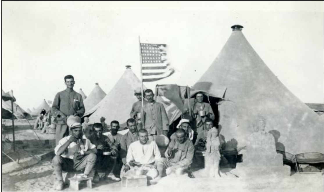
מתנדבים ארמנים-אמריקאים ב"לגיון המזרח"

ש: "נרשמו כמתנדבים לשרת למען שחרור ארמניה. הם אמרו שזה הזמן לנקום את נקמת הורינו, אחינו ואחיותינו..." 24 בסופו של דבר עמדה מצבת המתנדבים ללגיון על למעלה מ-4,000 מתנדבים, כ-1,200 מתוכם היו ארמנים-אמריקאים, אשר אורגנו בארבע גדודים אשר החלו באימונים בבסיס החדש שהוקם בקפריסין.